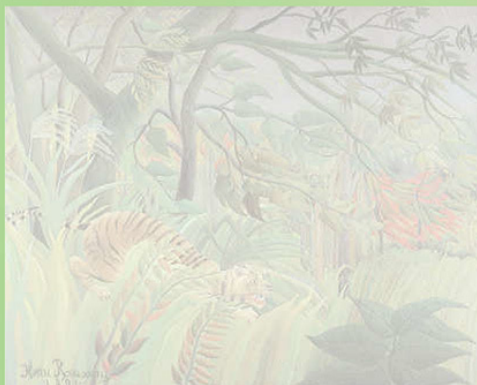
Tigrul într-o furtună tropicală/Surprins! (1891)

Această pictură luxuriantă și spectaculoasă a fost pictată în întregime din imaginația artistului. Henri Rousseau nu a fost niciodată în apropierea unei jungle. El a creat această scenă pornind de la schițele pe care le-a făcut în parcuri sau în grădini zoologice și de la lucruri pe care le-a citit în cărți.