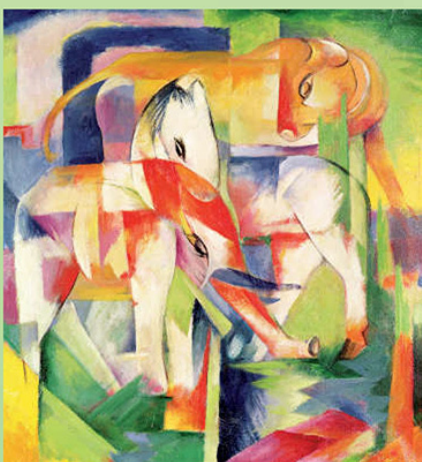
Elefant, cal, vacă (1914)

Artistul, George Stubbs, și-a dedicat mult timp pictării cailor. A publicat chiar o carte despre anatomia calului, ce conține ilustrații detaliate, inclusiv cu schelete de cai.