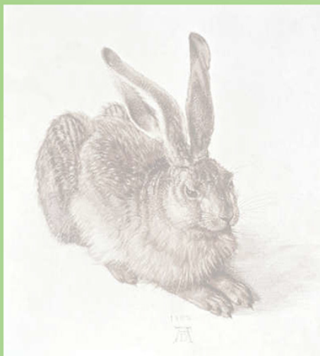
Iepure tânăr (1502)

Animale de tot felul au apărut deseori în tablouri, de la cai de curse până la creaturi exotice.