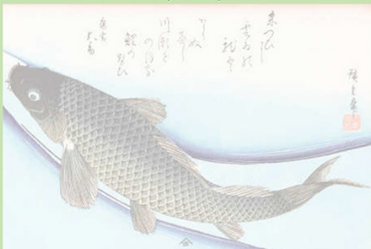
Crap într-un pârâu (1838)

În Japonia, crapii sunt un simbol al curajului și al perseverenței. Această stampă expresivă ilustrează un crap înotând într-un pârâu. Lumina îi pune în valoare solzii, proiectând irizații fascinante de-a lungul corpului său.